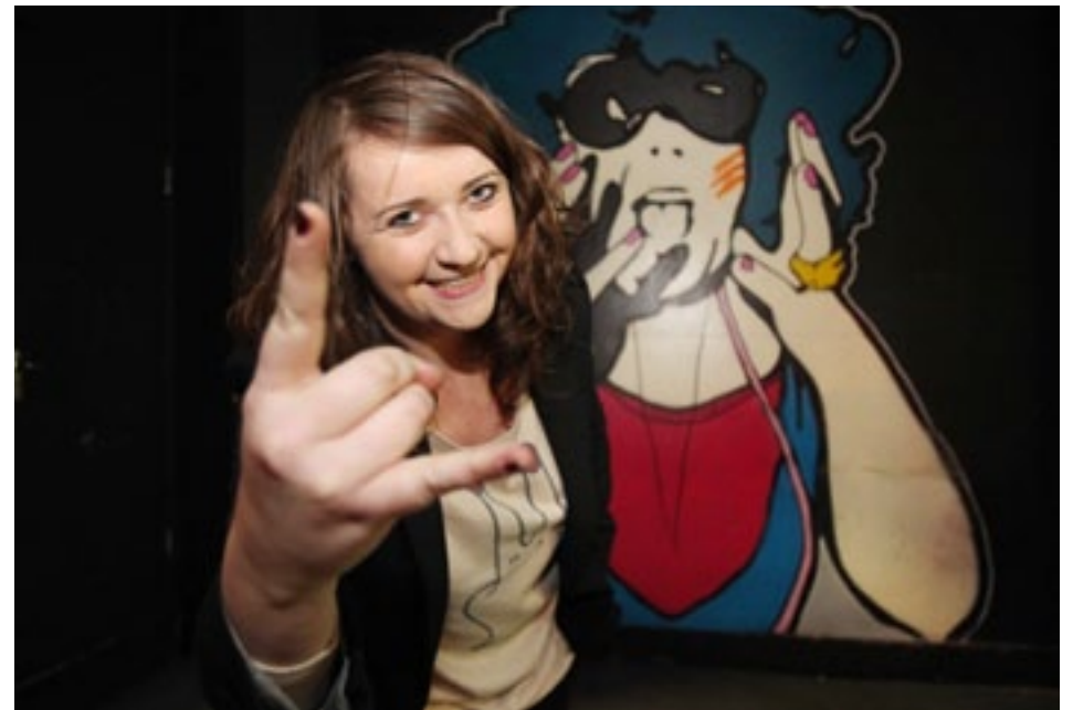
CEOL AR AN IMEALL