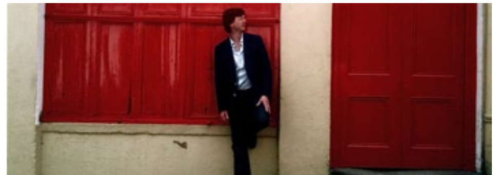
CÉ A CHÓNAIGH I MO THEACHSA?

Tabharfaidh sé cuairt ar na tithe le labhairt leis na húinéirí reatha ach beidh cúnamh aige freisin ó staraithe, ó chomharsana, ó ailtirí agus ón gcartlann agus é ag sníomh scéal saibhir le chéile ó fhoinsí éagsúla.