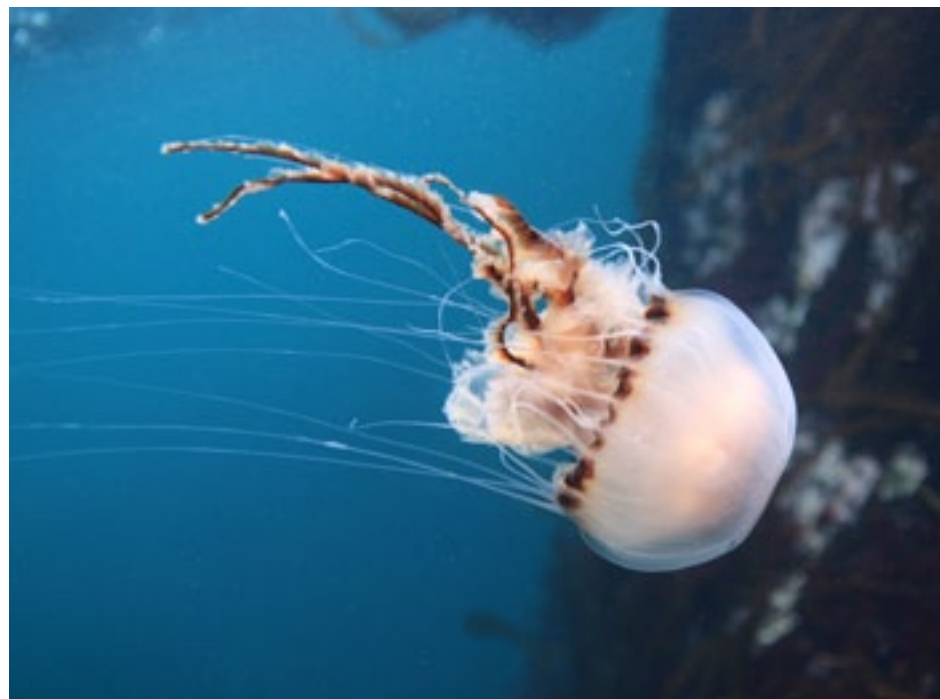
FARRAIGÍ NA hÉIREANN

Scoth na gclár dúlra ón domhan mór, athghuthaithe go Gaeilge.