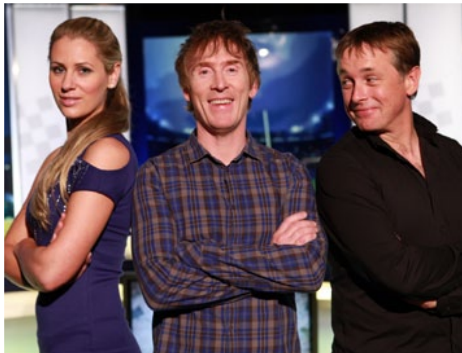
CEIST GAA LE HECTOR

Séasúr eile de chuimhní cinn agus ómós do mhór-imreoirí peile agus iomána ón am atá caite, ina measc DJ Carey, Dan Shanahan, Jimmy Barry Murphy, Mikey Sheehy, Oisín McConville agus Liam Hayes. Tugann na fir féin, a gcomhghleacaithe, a gcéilí comhraic agus tráchtairí aitheanta a mbreithiúnas féin orthu le cabhair ó mhíreanna ón gcartlann spóirt dá gcuid imeartha.