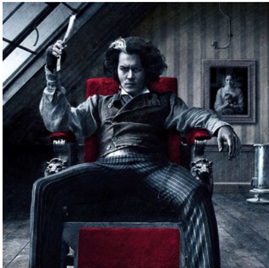
SWEENEY TODD THE DEMON BARBER OF FLEET STREET

Is ar an Satharn a bheidh na scannáin is fearr ar fáil feasta ó gach cearn den domhan: Atomised (The Elementary Particles) , Hana-bi , The Son's Room , Intacto , Gadjo Dilo , My Queen Karo , Dioses , Caterpillar and Beyond the Steppes